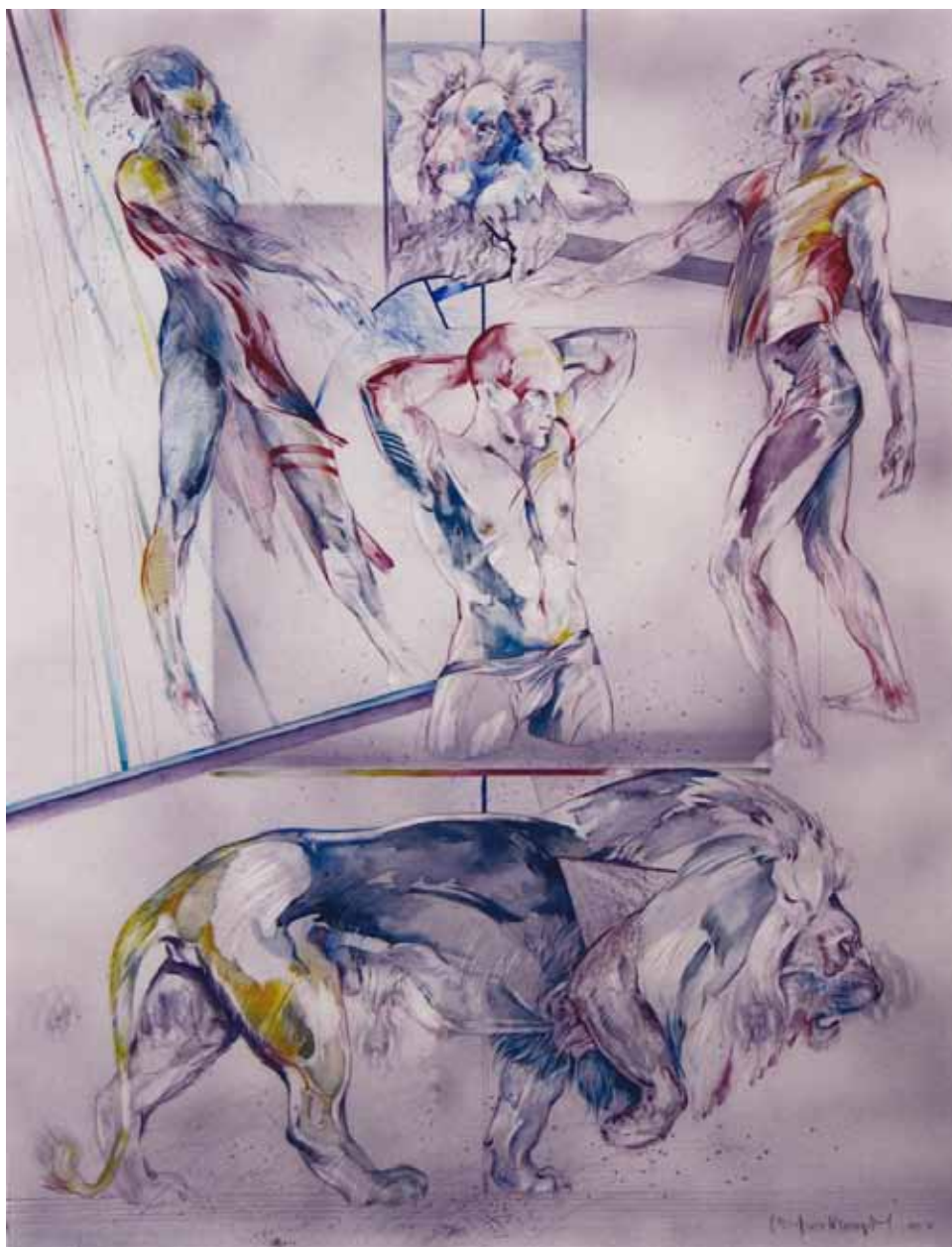
I am The KING 2004 65 cm h x 50 cm b Aquarel/akvarel De Groote-Tanghe, België